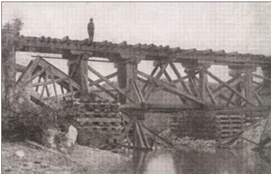
Náhrada odstřeleného mostu dřevěným

odháněl. Postup našich byl zatímně zastaven, začala stavba provizorních mostů a oprav tratí pro další pronásledování. Zatím se schylovalo k boji u Kaulu, který byl nakonec prvním neúspěchem, protože naši ustoupili. Ztratili 13 mrtvých, 44 raněných a 44. ztracených, kteří asi zahynuli v rozsáhlých bažinách. Nepřítel přiznal 105 mrtvých a 247 raněných. Došlo ještě k dalším střetům u Olchovky a u Antonovky, u Duchovského, ale zdali dědeček opravdu stál celou dobu u Nikolska až do 30. srpna, nebo zasáhl do bojů, je otázkou. Ale asi nestrojová rota měla své starosti se zajišťováním proviantu v zámezí, takže do bojů přímo nezasáhla. Bojů se s českými vojáky účastnili též vojáci angličtí a také Japonci, kteří nakonec obranu trati na Chabarovsk převzali. Dne 28. srpna odjel 5. pluk do Nikolska a odtud 30. srpna směrem na mandžuskou dráhu. Již 1. září si dědeček napsal, že jsou v Charbině na čínském území. Tady byl pluk slavnostně uvítán, zvláště ruskými utečenci a pluk zde setrval až do 18. září. Vojáci potřebovali nabrat síl po bojích bez vystřídání a i psychicky se srovnat.