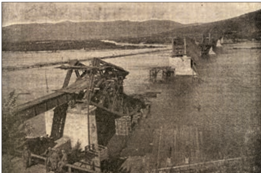
Ničený most přes řeku Onon a provizorní vedle

zas na ruském území pokračovali dál na západ napříč Sibiří k Uralu. Druhý prapor byl zatím ponechán v Charbině k vykonávání posádkové služby a IV. byl ještě na Ussurijské dráze, zbytek sestavil transport rozmístěný v pěti vlacích. Prvý odjel 17. září s I. praporem, za ním hned štáb pluku s telefonním a policejním oddílem. Další den odjel třetí vlak s III. praporem a ve čtvrtém vlaku následován neřadovou rotou. Zde se rozchází údaj dědečka, zapsal si odjezd z Charbiny o den později přes Aidu Cicingar. Jako poslední odjížděl vlak s plukovním dělostřelectvem a rozvědkou. 21/9 jsou ve Varynu, 22/9 do Vanganu a na stanici Mandžuria. 23. září přes stanici Borza, Chadabulak do stanice Olověnaja, kde byl rozbitý most přes řeku Onon. Další den jedou ze stanice Karinskaja a do Čity a Magdzanu. 25/9 Verchněudinsk, Misovaja, 26/9 kolem jezera Bajkal na stanici Bajkal, další den jsou v Irkutsku a další den ve stanici Zima - Tuluň, 29/9 stáli ve stanici Tuluň, 30/9 Nižněudinsk, Kaňsk Enisejský, prvního října Krasnojarsk, 2/10 Tažmir Marinsk, v Taize - Tomsk, 3/10 Novo-Nikolajevsk, 4/10 Kaňsk - Omský a večer v Omsku. Zde 5/10 vyjeli z magistrály na trať na severozád do Nišína, Tjumeně, Kamišlova a 6/10 skončili ve stanici Bogdanovič a 7/10 jsou v Jekatěrinburgu, kde se soustředily síly 5. pluku. Ještě týž den odjíždí děda do stanice Sargu, kde stojí až do 22/10 a najíždějí na rozjezd č. 61, odkud 27/10 odjíždí a příští den jsou zas v Jekatěrinburgu.