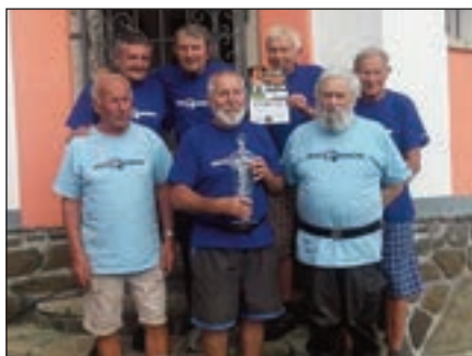
Nejstarší družstvo beneckých bezkonkurenčně ve své kategorii zvítězilo