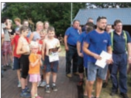
Nástup družstev k vyhlášení výsledků