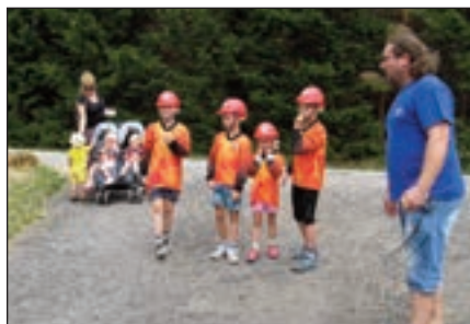
Nejmladší z hornoštěpanických na startu