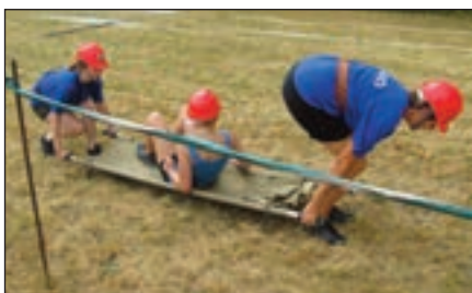
Dokončení útoku končí transportem raněné