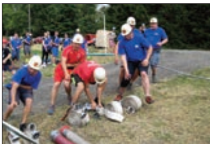
Každý se chápe své výzbroje