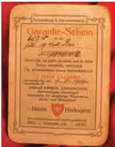
Stříbrné hodinky s kotvovým krokem a tepelnou mikroregulací a záručním listem.