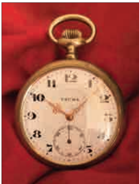
Hodinky okolo roku 1900 s kotvovým krokom.