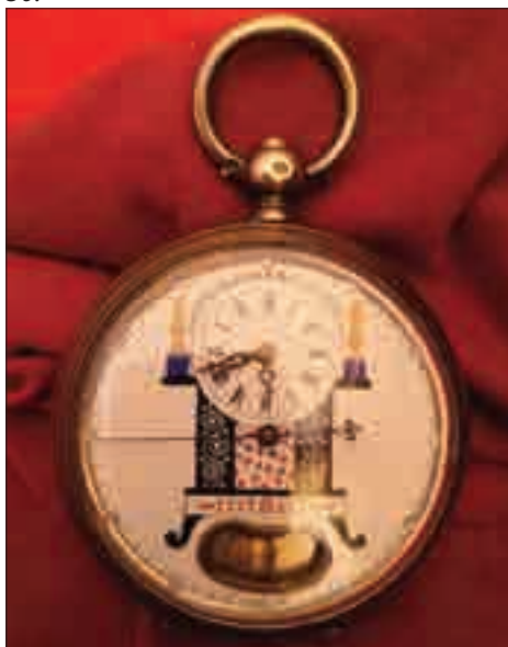
Speciální stříbrné hodinky s duplexním krokem, centrální vteřinovkou a pohyblivým kyvadlem.