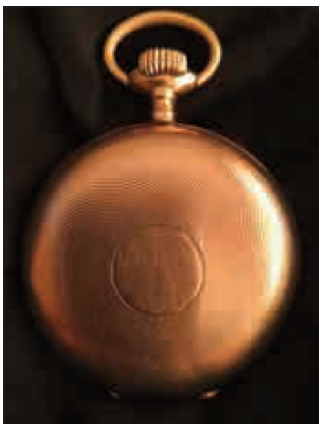
Celozlaté hodinky 14 karátů mezi lety 1920–1930.

čátku se jednalo o předělávky z hodinek kapesních, což bylo cenově výhodné proti nově vyrobeným náramkovým. Pánské náramkové hodinky v počátečních letech výroby měly převážně obdélníkový tvar, některé firmy se tohoto designu držely až do padesátých let 20. stol. a některé už v třicátých letech vyráběly tvary kulaté. Těsně po druhé světové válce se k nám ze Švýcarska dovážely velmi pěkné pozlacené a zlaté hodinky s chronografem, (stopkami), s označením chronographe – swisse. Jmenujme aspoň některé z firem: AUREOLE, MARVIN, BULOVA, ANKER, LEMANIA, ORIS, TISSOT, MOVADO, LONGINES, HEUER, IWC – SCHAFFHAUSEN, DOXA, OMEGA.