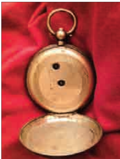
Hodinky s cylindrovým krokom na kliček, počátek dvacátého století.