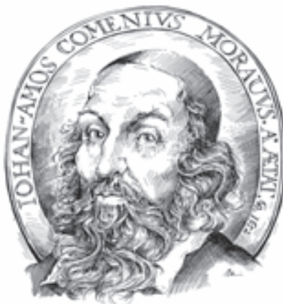
Co na to J. Á. Komenský?

A teď si představte, že je vám 12 let a máte 600 „přátel“. Většinu z nich vůbec nezajímáte a pro mnoho z nich jste konkurencí. V reálném „tváří v tvář“ životě těžko uneseme, když se jen pár přátel postaví proti nám, ale co když těch nemilosrdných kritiků povstane dvacet nebo stovka? Psychologové již dávno popsali, že když je více svědků nějakého zločinu, lidé méně zasahují, protože zodpovědnost je rozdělena mezi všechny přihlížející, a tudíž je ve větší skupině na osobu mnohem menší tlak se zapojit. Proto je pravděpodobné, že u velké facebookové skupiny se vás nikdo nezastane. Bude vám dvanáct, budete dívka citlivá na svůj vzhled, celý svět se otočí proti vám – a nikdo nepomůže. Budete úplně sama a vaše mysl ještě nebude umět