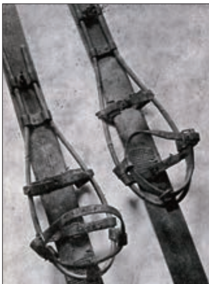
Kopie prvních lyží, která s jinými památkami na počátky lyžařství jest majetkem firmy Mečír a spol. vyrábějících lyže.

Vázání Širovo ze Branné bylo přesně dle vzorů alpských – stejných s norskými – nikoliv s volnou patou, jak se tvrdí o pozdějších lyžích štěpanických. Hůl byla jediná, jednoduchá nebo dvojitá, jak ji užívali lesníci