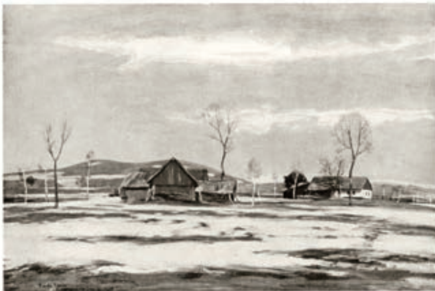
19. Podřehomřská řřř, 1906